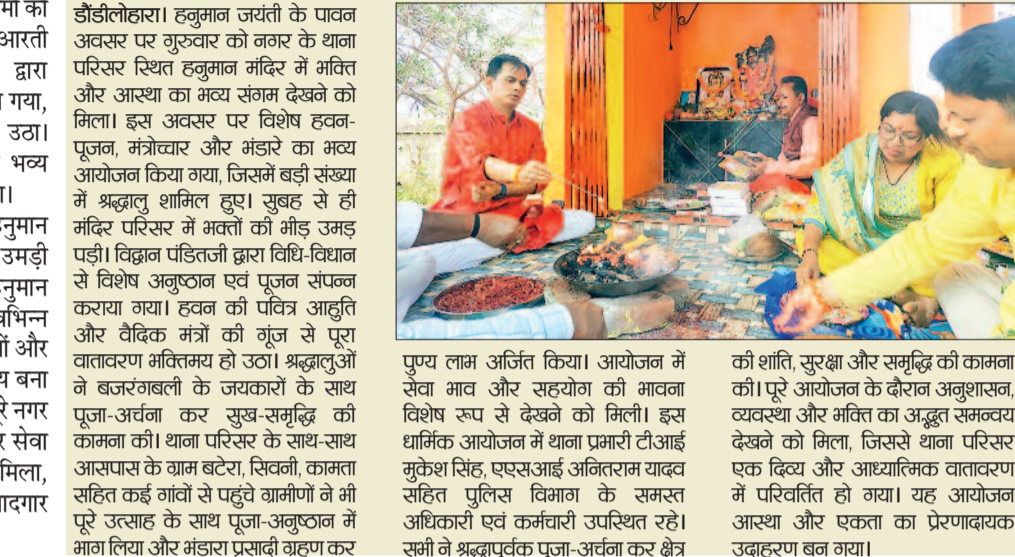
रखी ने श्रद्धालुओं की भीड़ उमड़ पड़ी। विद्वान पंडितजी द्वारा विधि-विधान से विशेष अनुष्ठान एवं पूजन संपन्न कराया गया। हवन की पवित्र आहुति और वैदिक मंत्रों की गूंज से पूरा वातावरण भक्तिमय हो उठा। श्रद्धालुओं ने जजरंगबली के जयकारों के साथ पूजा-अर्चना कर सुख-समृद्धि की कामना की। थाना परिसर के साथ-साथ आसपास के ग्राम बटेरा, सिवनी, कामता सहित कई गांवों से पहुंचे ग्रामीणों ने भी पूरे उत्साह के साथ पूजा-अनुष्ठान में भाग लिया और भंडारा प्रसादी ग्रहण कर

डौडीलोहारा। हनुमान जयंती के पावन अवसर पर गुरुवार को नगर के थाना परिसर स्थित हनुमान मंदिर में भक्ति और आस्था का भव्य संगम देखने को मिला। इस अवसर पर विशेष हवन-पूजन, मंत्रोच्चार और भंडारे का भव्य आयोजन किया गया, जिसमें बड़ी संख्या में श्रद्धालु शामिल हुए। सुबह से ही मंदिर परिसर में भक्तों की भीड़ उमड़ पड़ी। विद्वान पंडितजी द्वारा विधि-विधान से विशेष अनुष्ठान एवं पूजन संपन्न कराया गया। हवन की पवित्र आहुति और वैदिक मंत्रों की गूंज से पूरा वातावरण भक्तिमय हो उठा। श्रद्धालुओं ने जजरंगबली के जयकारों के साथ पूजा-अर्चना कर सुख-समृद्धि की कामना की। थाना परिसर के साथ-साथ आसपास के ग्राम बटेरा, सिवनी, कामता सहित कई गांवों से पहुंचे ग्रामीणों ने भी पूरे उत्साह के साथ पूजा-अनुष्ठान में भाग लिया और भंडारा प्रसादी ग्रहण कर